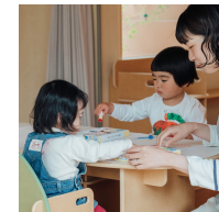
子どもにつながる

高齢者福祉を中心に、 保育・学生・地域交流など、 多世代が自然につながる場を育んでいま す